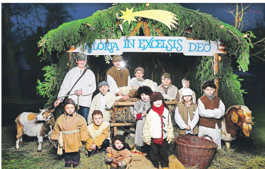
● Focení pro MF DNES odmítl pouze jeden malý „ubřečený“ Ježíšek...