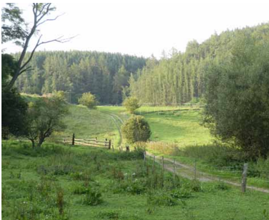
● Vítězný snímek fotografické soutěže „Otročiněves v proměnách roku“ Marty Holé.