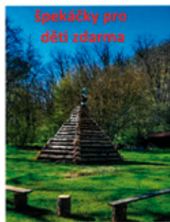
Spokáčky pro děti zdarma