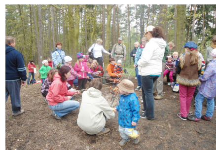
● Květnový pochod na Děd