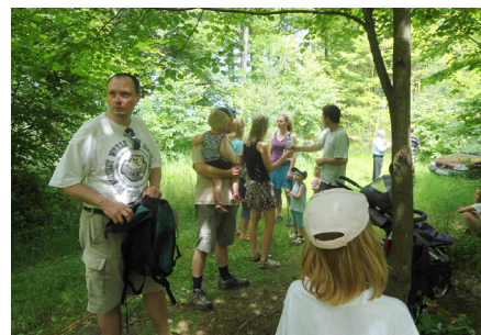
● Jarní pouť na Hudlický vrch