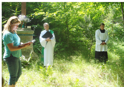
● Jarní pouť na Hudlický vrch