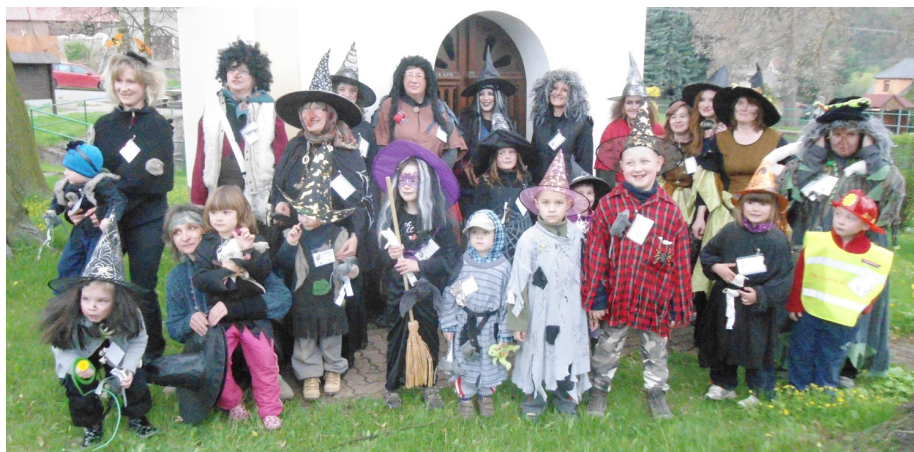
● Slet čarodějnic v Otročiněvsi.