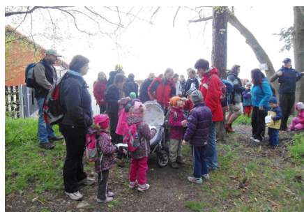
● Květnový pochod na Děd