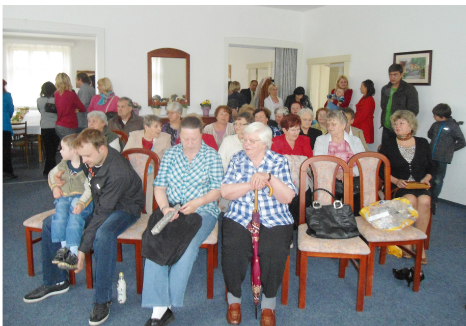
● Oslava Dne matek v Otročíněvsi