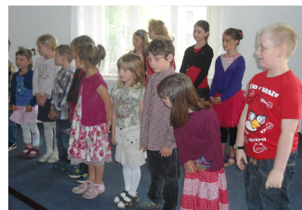
● Oslava Dne matek v Otročiněvsi