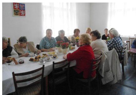
● Oslava Dne matek v Otročiněvsi