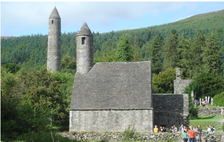
● Klášter v Glendalough - legendární místo irské historie.

Takže to je jen takový krátký přehled toho, co se zatím událo.