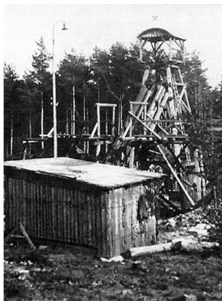
● Důl XIV v Protilehlém ložisku - rok 1929.

Kolem roku 1900 začal, především ve vedení Pražské železářské společnosti, majitelky těžebních licencí ve východní části nučického