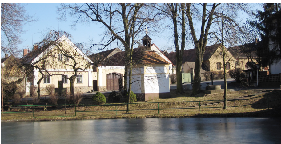
● Březnový pohled na otročiněveskou návěs.