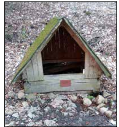
● Sládkova „Kříšťálová“

nenapijete, ale jsou důvodem, proč je vrchol tohoto kopce obýván téměř od nepaměti, a které také trochu souvisí s nejstarším záznamem o naší obci, jak jsem psal v jednom z minulých povídaní.