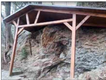
● Skální studánka „Rozárka“ ve Zbečně