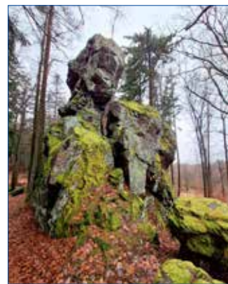
● Skalka Jedlová věž u hájovny Hřebeny