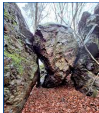
● Přírodní brána v uklíněného balvanu u Kublova