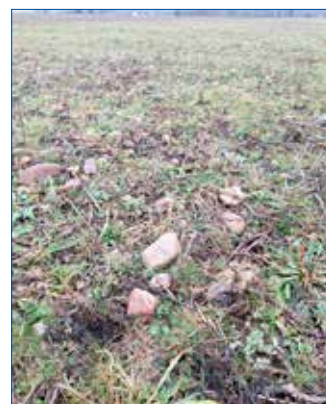
● Říční valounky nad Žloukovcemi, 80m nad hladinou Berounky