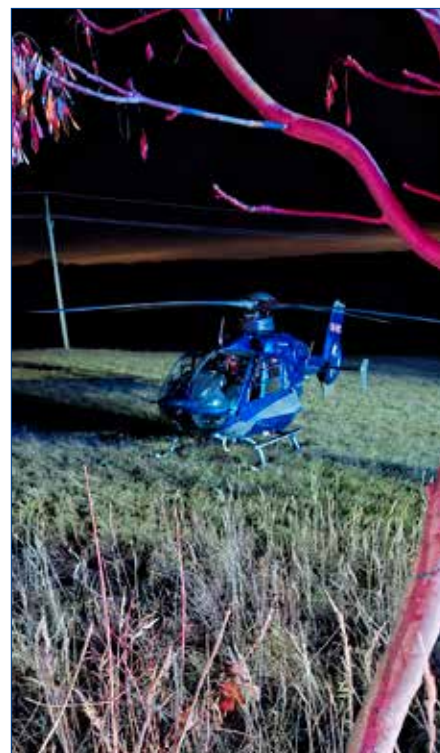
● Prasklá voda